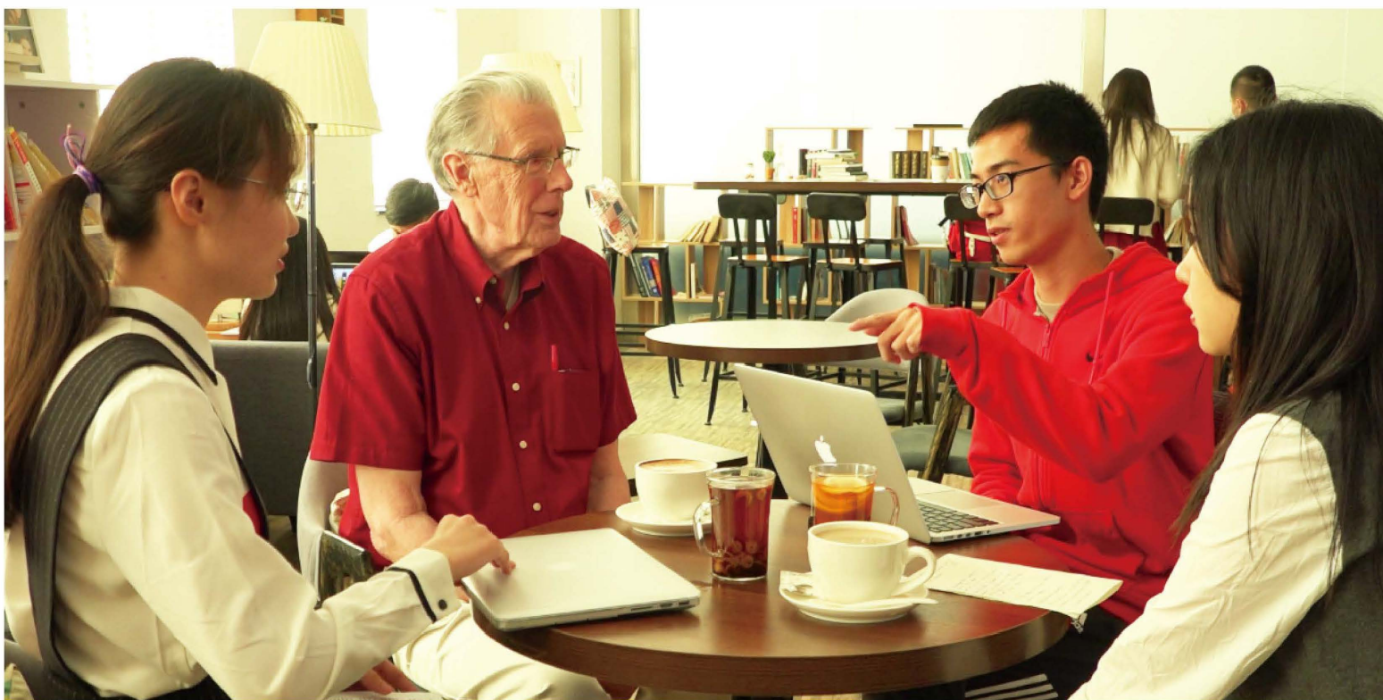
John Hopcroft 教授与学生们交流 Professor John Hopcroft is communicating with students

而作为港中大（深圳）《信息时代的数学》（Mathematics for the Information Age）的课程负责人，John Hopcroft 教授已于2016年下半年开始为我校理工学院学生授课，并开办多场学术交流讲座，参加学术研究和交流活动，同时，指导学生们开展学术讨论会议，给学生们分享其最新研究成果，并且积极参与人才培养工作。