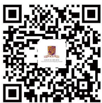
Prof. Myron Scholes's speech

the modernization of finance and the innovations in finance will have a dramatic effect on the wealth and growth of China," said Prof. Myron Scholes. "I am proud that the Chinese University of Hong Kong, Shenzhen is in the center of technological innovation. You and your fellow students reflect this emphasis. I am excited that the financial technology center will foster further studies and modeling of the interactions between technology and finance.", Prof. Myron Scholes mentioned that Chairman Xi once said that finance and financial intermediation will play an important role in making China "moderately prosperous" in the coming years." The internationalization of the yuan will be a necessary step to facilitate wealth creation. This is a new and exciting frontier."